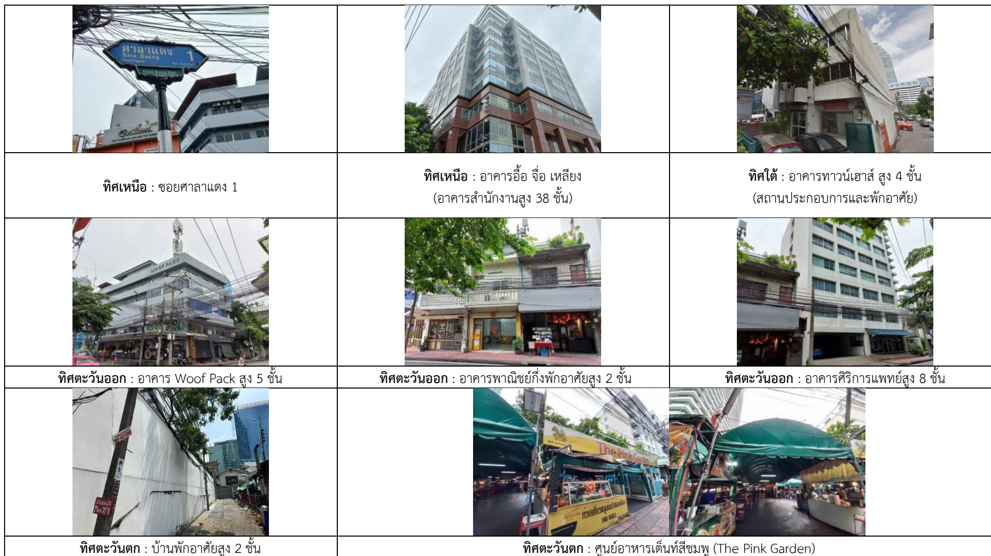
รูปที่ 1.2 แสดงการใช้ประโยชน์บริเวณพื้นที่โครงการและพื้นที่ใกล้เคียง