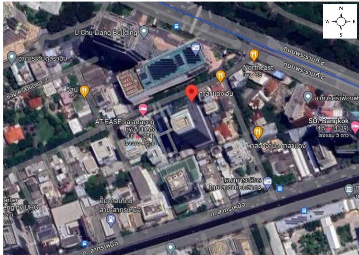
รูปที่ 1.1 พื้นที่ตั้งของโครงการ